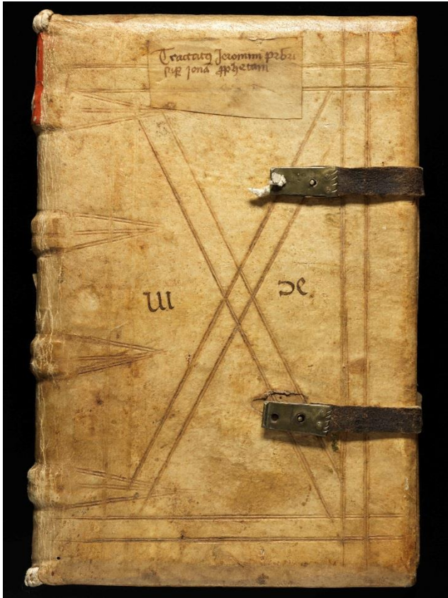
Einband vom Typ A, ca. 1460. (Cod. Sang. 123; http://www.e-codices.unifr.ch/de/list/one/csg/0123 ).

Das zweite hier hervorzuhebende Kapitel handelt von der Bibliothek und ihrer Organisation, vom damaligen Bücherbestand und Bücherzuwachs, von den Aufbewahrungsorten der Bücher sowie von der Herstellung neuer Einbände um 1460 und im vorangehenden Jahrzehnt. Einen Schwerpunkt bilden in dieser Hinsicht die neu geschaffene Typologie dieser Neubindungen sowie die Auflistung sämtlicher Exemplare dieser Einbandtypen. Dank dem fünfseitigen Handschriftenregister können sämtliche erwähnte Codices bequem aufgefunden werden.